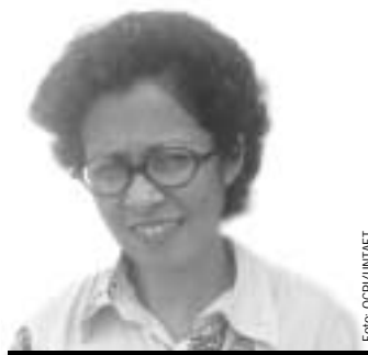
Emília Pires, Directora do Organismo Nacional de Planeamento e Desenvolvimento.

A Directora do ONPD, Emília Pires, informou o Gabinete de Transição de Timor Leste das iniciativas e explicou que