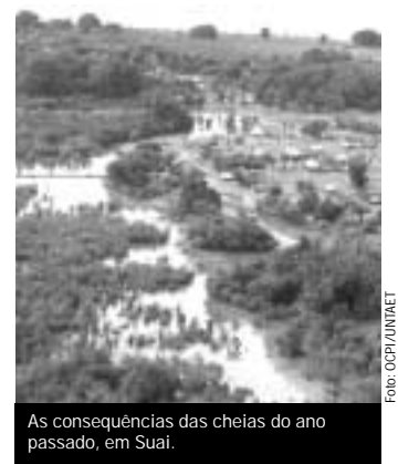
As consequências das cheias do ano passado, em Suai.

Divisão de Assuntos Agrícolas A Campanha de Vacinação Animal está prestes a terminar. Mais de 100 000 búfalos e gado de Bali foram vacinados contra a septicemia hemorrágica aguda, uma doença bacteriana fatal.