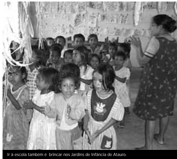
Ir à escola também é brincar nos Jardins de Infância de Atauro.

"O facto de as professoras não terem formação académica revelou-se uma grande vantagem", afirma a Sr.ª Samson. Refere que as aulas são mais vivas, mais dinâmicas, e que as crianças estão mais atentas e respondem melhor, em vez de ficarem sentadas numa atitude passiva, como acontece com os alunos das escolas oficiais.