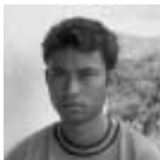
Acasio Student Becora

O que eu sei é que a corrupção em Timor Leste começou quando a Indonesia foi atingida pela crise financeira. E este é o apelo que faço a todos os timorenses: para que o nosso país viva em paz, não podemos deixar a corrupção prosperar. Lutámos durante vinte e quatro anos para expulsar os corruptos de Timor Leste. Temos de ser sensatos e dedicarmo-nos à construção do nosso país.