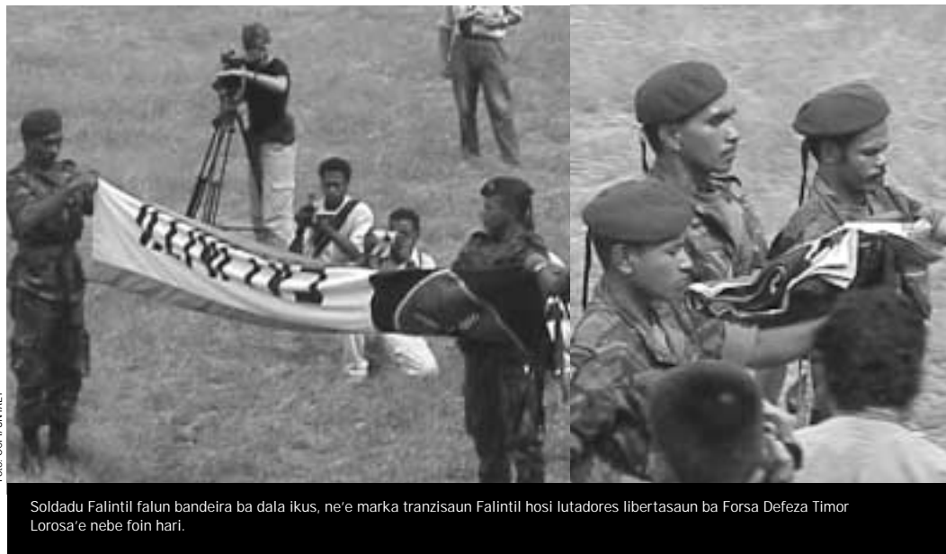
Soldadu Falintil fulun bandeira ba dala ikus, ne'e marka tranzisaun Falintil hosi lutadores libertasaun ba Forsa Defeza Timor Lorosa'e nebe foin hari.