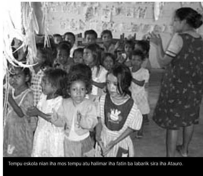
Tempu eskola nian iha mos tempu atu halimar iha fatin ba labarik sira iha Atauro.