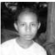
Ajia Eskola Siklu Preparatoria Becora /Becussi baixo

It is difficult for me to imagine a nation without any corruption. I know there is corruption here, which is why we cannot live in peace. There are instigators inside this nation to bring down each other. In a company, workers try and find ways of bringing down their fellow workers but in the end the people are the ones who suffer the most. But how can we prevent corruption and nepotism in our nation? We must realize that if we keep doing this it will be our downfall. The people have put their trust in the leaders to re-build our nation for which we fought for 24 years.