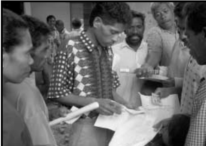
Catatan Sipil Timor Timur menyelenggarakan proyek percontohan pencatatan sipil selama lima hari di pulau Atauro pada 26 Februari sebagai persiapan bagi peluncuran pendaftaran nasional tanggal 16 Maret. Lima lokasi pendaftaran didirikan dan delapan tim registrasi ditugaskan. Informasi dikumpulkan untuk pembuatan Kartu Tanda Pengenal (KTP) yang dikeluarkan untuk penduduk di atas usia 16 tahun dan untuk mengumpulkan data yang diperlukan mengenai calon pemilih yang memenuhi syarat untuk mengikuti pemilihan umum mendatang.

ian termasuk traktor dan ekskavator sumbangan Pemerintah Cina. Sumbangan tersebut bernilai lebih dari AS$6 juta. Upacara penyerahan sumbangan itu berlangsung di Gedung Kopi di Tibar di luar kota Dili.