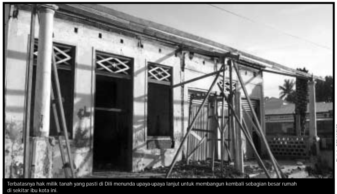
Terbatasnya hak milik tanah yang pasti di Dili memunda upaya-upaya lanjut untuk membangun kembali sebagian besar rumah di sekitar ibu kota ini.