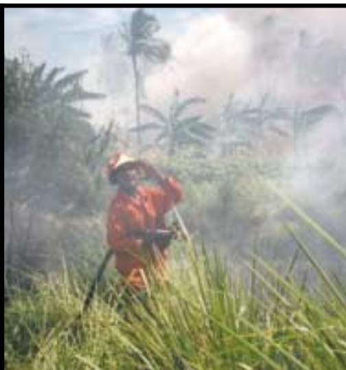
Pahlawan berjuang! Para bombeiros berusaha memadamkan kebakaran di dekat Depot Pertamina di Dili pada 3 Maret.