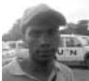
Zito Pedagang kartu telepon, Becora

FALINTIL mempunyai peran yang penting di Timor Timur sewaktu Indonesia berkuasa. Anggota FALINTIL mengorbankan jiwa mereka dan menderita dalam kondisi alam yang ekstrem, hujan, terik matahari atau angin kencang semuanya karena rakyat menginginkan kebebasan. Peralihan dari FALINTIL menjadi Angkatan Pertahanan Timor Lorosa'e adalah suatu perkembangan yang baik bagi negeri kita karena angkatan yang baru ini akan memperoleh berbagai jenis pelatihan profesional dari Portugal tentang cara untuk melindungi perbatasan kita.