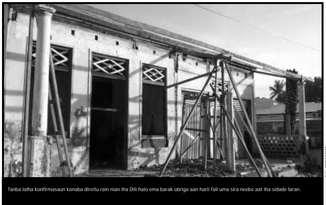
Tanba laiha konfirmasaun konaba direitu rain nian iha Dili halo ema barak obriga aan harii fali uma sira neebe aat iha sidade laran.