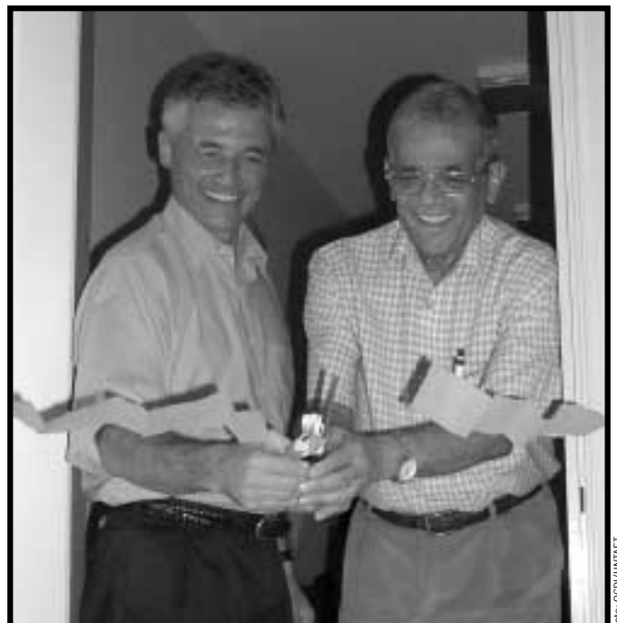
Ceremonia tesi fita ho SRSG Sergio Vieira de Mello no Mario Carrascalão. Sentru Selu Osan Timor Lorosa'e (CPO) iha loron 28 fulan Febreiru ninia servisu fatin iha hadia hotu tiha ona.

TVTL mos fo sai programa husi BBC, Televisaun Indonesia nian, nutisia Portuguese nian husi kanal RTP no MTV. >