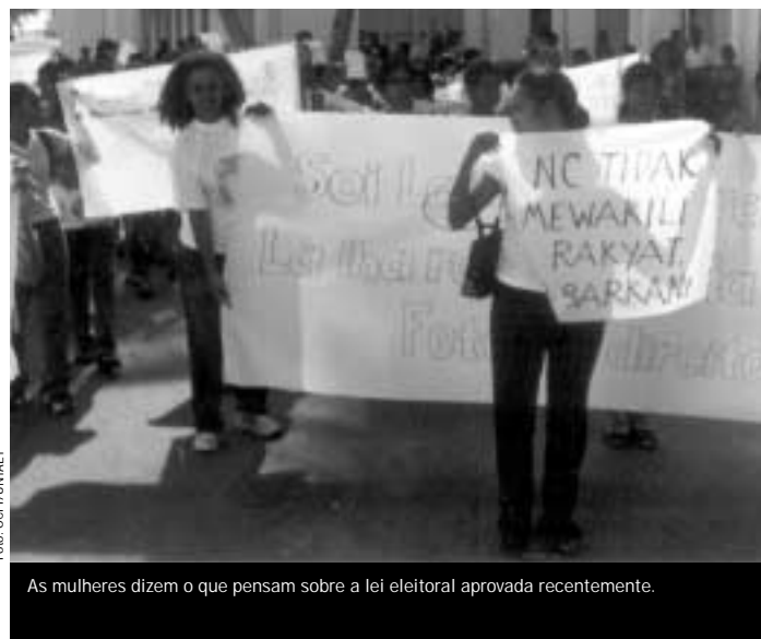
As mulheres dizem o que pensam sobre a lei eleitoral aprovada recentemente.

Timor Leste vai eleger uma Assembleia Constituinte composta por 88 deputados. Cada distrito irá eleger um representante numa base maioritária e 75 deputados serão eleitos numa base proporcional. A assembleia eleita irá redigir e aprovar uma constituição de um Timor Leste independente e democrático, num período de 90 dias. >