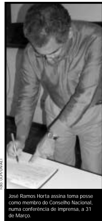
José Ramos Horta assina toma posse como membro do Conselho Nacional, numa conferência de imprensa, a 31 de Março.

O regulamento cria também uma Comissão Eleitoral Independente, com autoridade eleitoral exclusiva. A Comissão será composta por um Funcionário Eleitoral Principal e cinco Comissários Eleitorais, dois timorenses e três peritos eleitorais reconhecidos internacionalmente e um, sem direito a voto, que serão nomeados pelo Secretário-Geral das