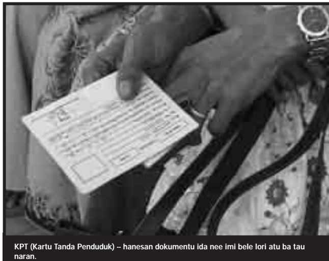
KPT (Kartu Tanda Penduduk) -- hanesan dokumentu ida nee imi bele lori atu ba tau naran.

Prosesu Taunaran Sivil sei lao nafatin, no imi sei bele ba tau naran hanesan sidadaun Timor Lorosa'e liu tiha loran 20 fulan Junhu. >