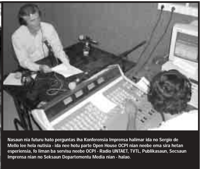
Nasaun nia futuru hatu perguntas iha Konferensia Imprensa halimar ida no Sergio de Mello lee hela nutisia - ida nee hotu parte Open House OCPI nian neebe ema sira hetan esperiensia, fo liman ba servisu neebe OCPI - Radio UNTAET, TVTL, Publikasaun, Secsaun Imprensa nian no Seksaun Departementu Media nian - halalo.