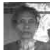
Bibuti Fan sasan nain Lauhata/Liquica

Hau seidauk bataunaran tanaba Selkom ho Nurep seidauk haruka ami atu ba tau naran. No sira mos seidauk fo hatene mai ami konaba dokumentu saida mak tenki lori hamutuk ho ami; ami foin mak rona buathirak nee husi Radio UNTAET. Ami tuir loloos atu lori ami nian Certidaun Batismu no KTP. Iha Lauhata ami la hatene bainhira mak tau naran komesa no bainhira mak atu hotu.